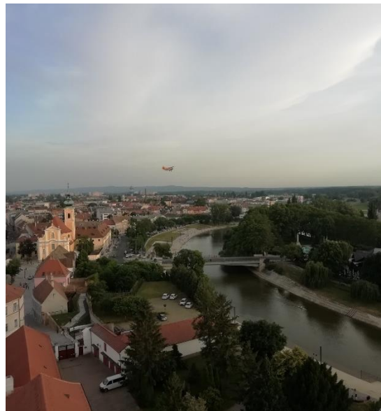
Abendstimmung in der schönen Stadt Győr, Ungarn